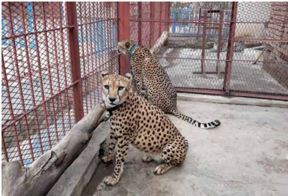
Deze twee volwassen cheeta's werden door de autoriteiten in de dierentuin van Sanaa ondergebracht, nadat ze aan de grens van Jemen met Saudi-Arabië in beslag waren genomen van een smokkelaar.