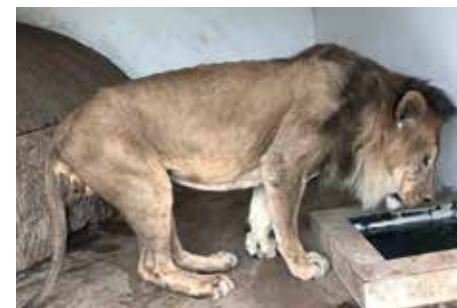
Een 'vóór-foto' van een leeuw die water drinkt, genomen tijdens inventarisatie door IFAW.

De oplossing voor hongerige, ondervoede leeuwen en jachtluipaarden lijkt simpel: ze meer eten geven. Maar zo simpel lag het niet. De situatie werd namelijk door verschillende factoren beïnvloed en verergerd. De Jemenitische overheid is eigenaar van de dierenparken, maar besteedt haar geld nu aan de bestrijding van het oorlogsgeweld in het land in plaats van aan de dierenparken. Voor de oppassers werd het hierdoor een groot probleem om hun dieren te eten te geven.