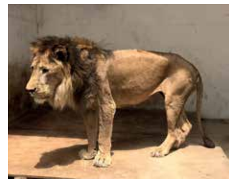
Een vermoeide, sterk vermagerde leeuw in de dierenpark van Jemen in de eerste fase van de hulpactie door IFAW.

De regering staat niet toe dat de dieren naar een ander land worden overgebracht om daar te herstellen. En daardoor werd het voor ons nog belangrijker om samen te werken met de dierenparken en de oppassers. Eén van de eerste problemen waar we tegenaan liepen, was het ontbreken van basisbenodigdheden in Jemen (voedsel en medische artikelen). Verder moesten we een vertrouwensrelatie opbouwen met de dierenparken. Vertrouwen opbouwen