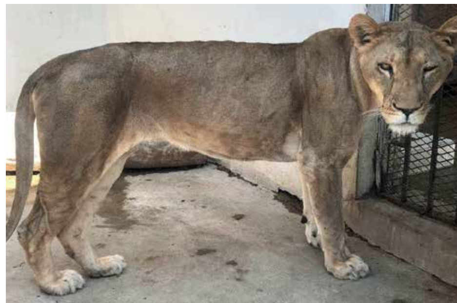
Een leeuw in de dierentuin in Jemen maakt het een stuk beter dankzij het voedsel en de medische supplementen die door IFAW zijn gedoneerd.

Het laatste nieuws over dit project is dat we voldoende donaties hebben ontvangen om niet alleen de financiële steun voor de vleeseters van de dierentuin in Taiz te verlengen, maar ook een extra dierentuin in Jemen (in de stad Ibb) aan het hulpprogramma toe te voegen.