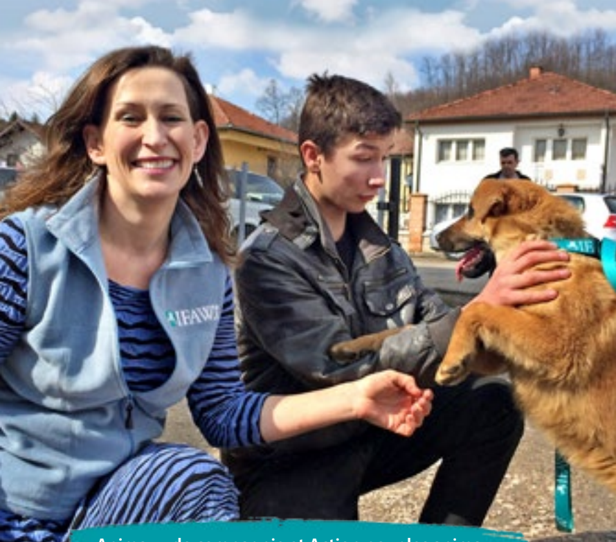
Animaux de compagnie et Action pour les animaux