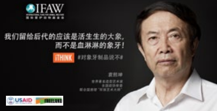
« Des éléphants vivants ou de l'ivoire taché de sang en héritage ? Nous devons choisir les premiers ! » — Yuan Xikun, artiste célèbre