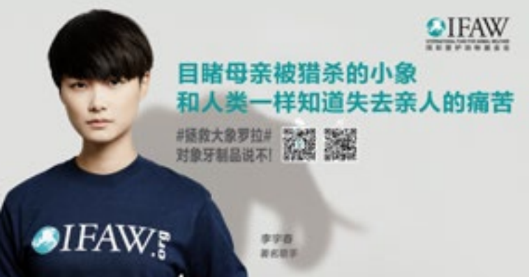
« Est-ce que je vous verrai encore dans dix ans ? Si nous n'arrêtons pas d'acheter de l'ivoire, nous pouvons vous dire adieu ! » – Lin Yuchun, pop star