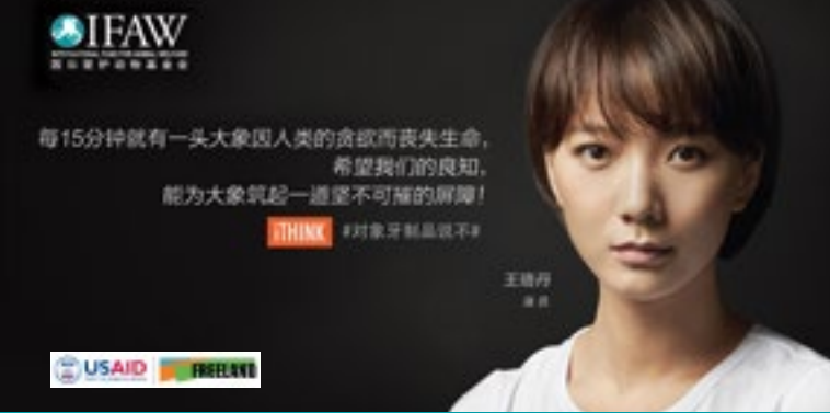
« Toutes les 15 minutes, un éléphant est tué pour son ivoire. J'espère que nous pourrions bâtir une barrière efficace pour protéger les éléphants avec nos consciences. » – Wang Luodan, actrice