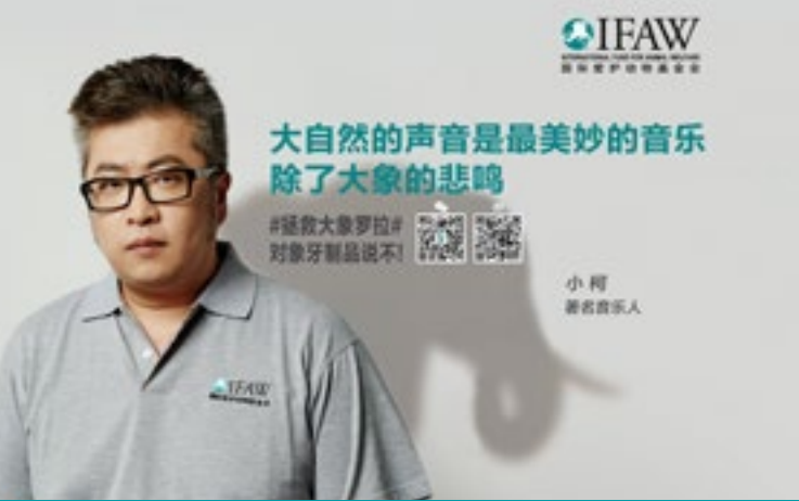
« Les sons de la nature font la plus belle musique, à l'exception des trompettes des éléphants qu'on massacre. » – Xiao Ke, musicien célèbre