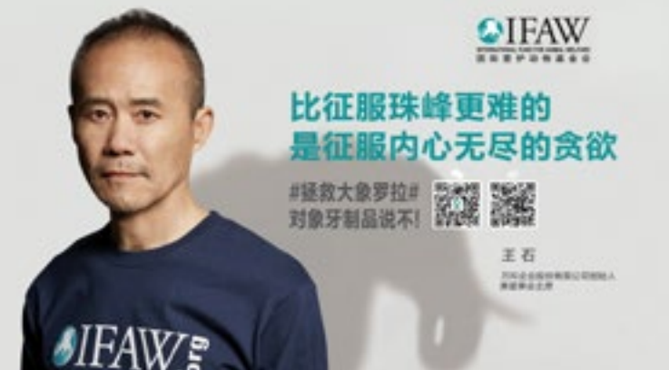
« Il y a mieux que "vaincre" l'Everest : vaincre sa propre cupidité » – Wang Shi, promoteur immobilier