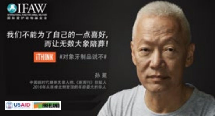
« Nous ne pouvons pas laisser les éléphants mourir à cause de notre appétit frivole pour l'ivoire. » – Sun Mian, pionnier des médias